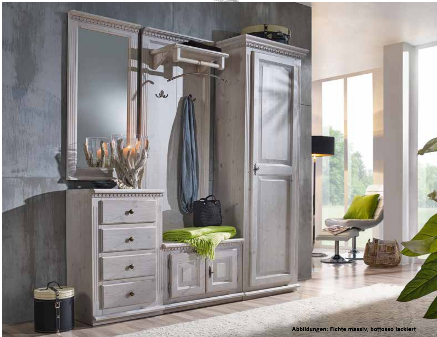
Abbildungen: Fichte massiv, bottosso lackiert

Spiegel 1930 B 50 / H 108 / T 7 cm Kommode 1957 B 50 / H 82 / T 39 cm