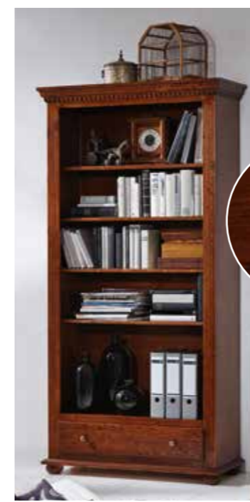
Regal 1960 4 Einlegeböden B 98 / H 195 / T 39 cm Abbildung: bassano lackiert mit Gebrauchsspuren