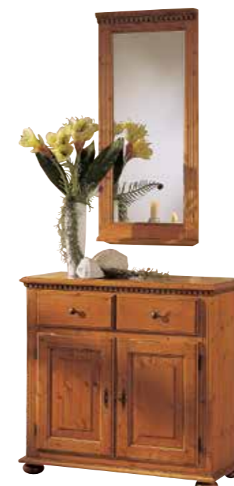
Spiegel 1930 B 50 / H 108 / T 7 cm Abbildung: firenze lackiert Kommode 1921 1 Einlegeboden B 95 / H 90 / T 39 cm Abbildung: firenze lackiert