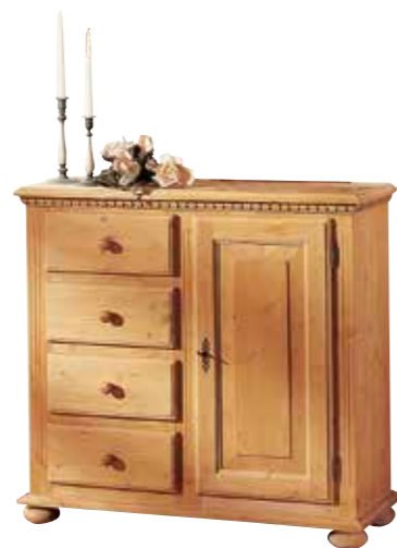
Kommode 1990 1 Einlegeboden B 95 / H 90 / T 39 cm Abbildung: natur gewachst