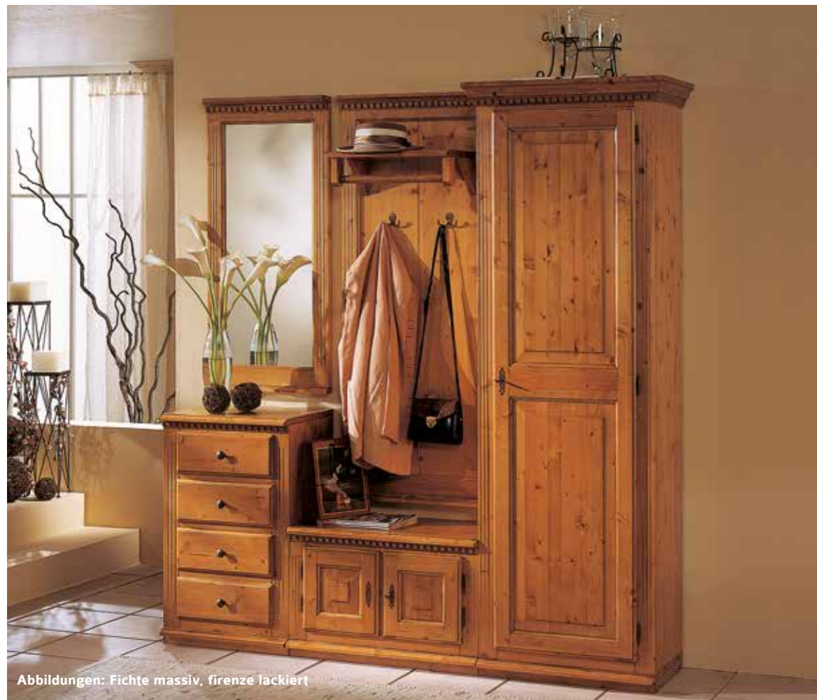
Abbildungen: Fichte massiv, firenze lackiert