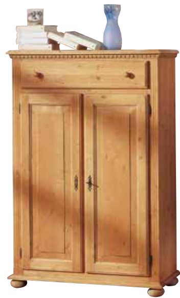
Vertiko 1965 2 Einlegeböden B 95 / H 140 / T 39 cm Abbildung: natur gewachst

Alle Kommoden auch ohne Platten- und Bodenüberstand und mit Sockel lieferbar zum Anstellen an die Garderobenkombinationen.