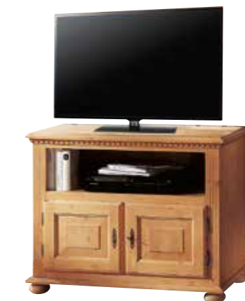
Phonokommode 1991 1 Einlegeboden B 95 / H 75 / T 50 cm Abbildung: natur gewachst