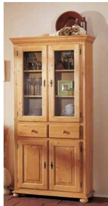
Vitrine 1962 oben 2 Einlegeböden, unten 1 Einlegeboden B 98 / H 195 / T 39 cm Abbildung: natur gewachst