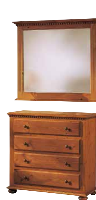
Spiegel 1940 B 98 / H 85 / T 7 cm Abbildung: firenze lackiert Schubkommode 1968 B 95 / H 90 / T 39 cm Abbildung: firenze lackiert