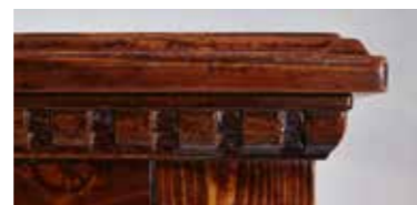
Sideboard 1923 je 1 Einlegeboden B 137 / H 90 / T 39 cm Abbildung: bassano lackiert mit Gebrauchsspuren