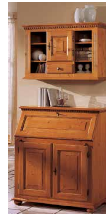
Hängeschrank 1981 passt auch über alle Kommoden B 92 / H 60 / T 31 cm Abbildung: firenze lackiert