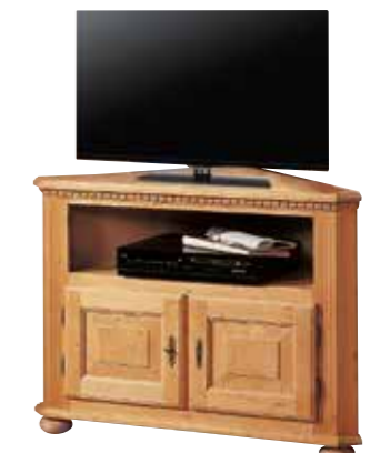
Eckphonokommode 1993 Schenkelmaß 80 cm, 1 Einlegeboden B 112 / H 75 / T 74 cm Abbildung: natur gewachst